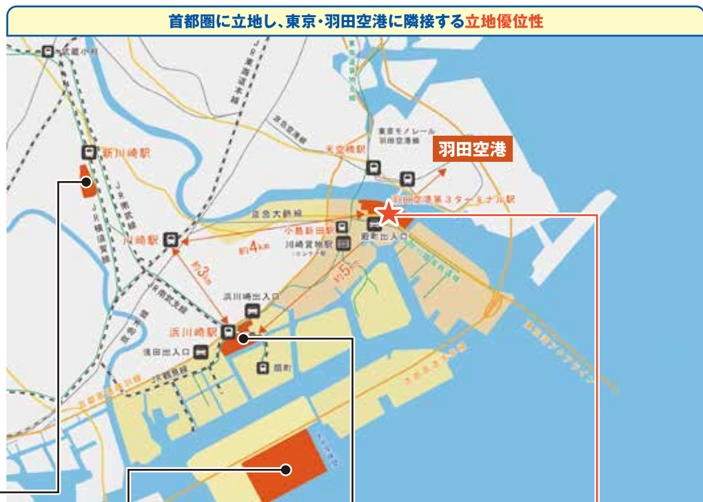
首都圏に立地し、東京・羽田空港に隣接する立地優位性